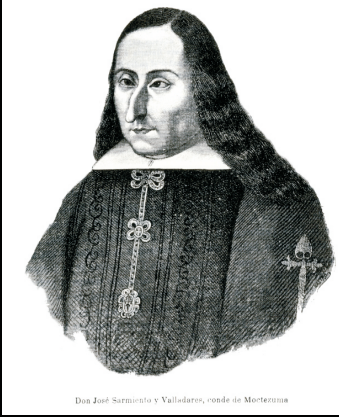
Don José Sarmiento y Valladares, conde de Moctezuma