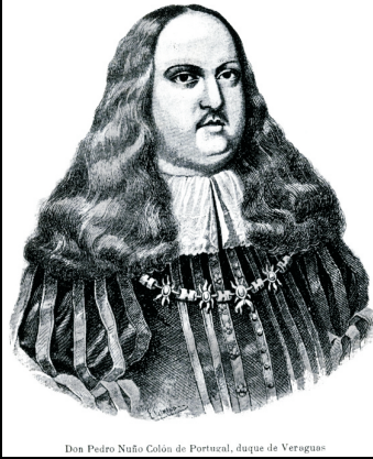
Don Pedro Nuño Colón de Portugal, duque de Veragua